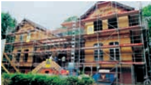
Das Hospiz, Richtfest Juni 2004

A m 22. März öffnet das Diakonie-Hospiz Lichtenberg (Haus 21) seine Pforten. Nach fast dreijähriger Zeit der Konzeptentwicklung und Bauplanung sowie des Aufbaus eines ambulanten Hospizdienstes mit 30 ehrenamtlichen MitarbeiterInnen, ist es soweit: 10 geräumige Einbettzimmer stehen bereit, um sterbenskranken Menschen mit palliativem Versorgungsbedarf zu einem guten Ort für die letzte Lebenszeit zu werden. Durch die haupt- und ehrenamtlichen MitarbeiterInnen erhält jeder Gast eine fachgerechte medizinische und pflegerische Versorgung sowie eine individuelle psychosoziale und seelsorgerliche Begleitung. Auch die Angehörigen sollen in ihrer Situation Unterstützung finden. Das Diakonie-Hospiz Lichtenberg ist das erste stationäre Hospiz im Ostteil Berlins. Wie bei allen stationären Hospizen sind 10 % der anfallenden Kosten über Spendenmittel zu finanzieren. Mit ihrem Engagement in der Hospizarbeit entsprechen die drei Gesellschafter – die von Bodelschwingschen Anstalten Bethel, das Ev. Diakoniewerk Königin Elisabeth und das KEH – ihrem christlich-diakonischen Anliegen, in unserer Gesellschaft immer wieder neu für die Belange von schwachen, kranken und sterbenden Menschen zu sensibilisieren und sich an deren Seite zu stellen.