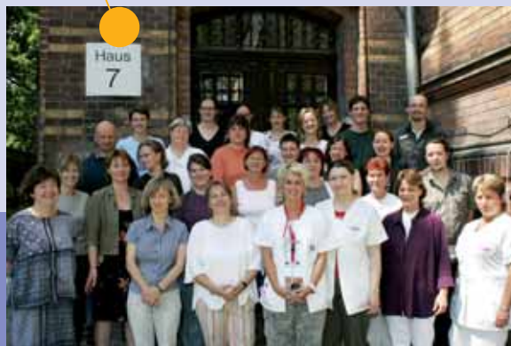
Das Team der Psychiatrie und Psychotherapie des Kindes- und Jugendalters am KEH

Die Abteilung kooperiert eng mit anderen Einrichtungen und Hilfetägern im psychosozialen Bereich. Gemeinsame Anstrengungen mit diesen wichtigen Partnern in der Versorgung und Betreuung zielen dabei auf eine dauerhafte und effektive Hilfe für unsere Patienten.