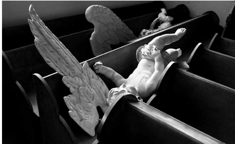
So manche Tradition macht im Sprengel Görlitz Neuem Platz wie diese „gefallenen Engel“ in der Peterskirche. Ob das Gotteshaus auf dem Hügel über der Neiße Predigtkirche des neuen Superintendents bleibt, ist noch offen.

Ab Januar 2007 gibt es im Sprengel Görlitz einen neuen Kirchenkreis. Noch fehlen Name und Sitz