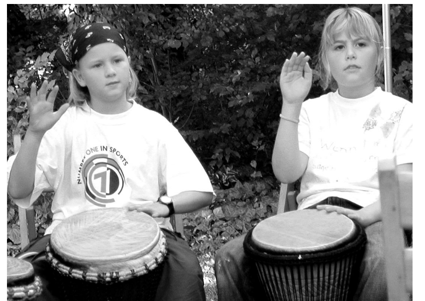
Mit voller Konzentration versuchen die Trommlerinnen das Herzklopfen nachzuahmen.

Zwischen den Kursen wurde natürlich auch Wissen vermittelt und zwar anhand des Labyrinthes, das von der Pritzerber Gemeinde im Kirchgarten angelegt worden ist. Es besteht aus Feldsteinen und